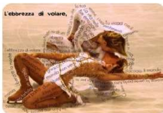
L'ebbrezza di volare Beatrice Scarpa - Classe 2 E Poesia su immagine Giornalino Scuola Chiaro Scuro n. 6