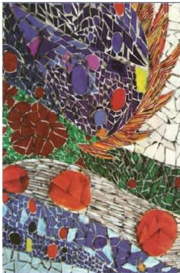
Giornale scolastico Liceo Statale d'Arte Roma 2 Giornalino Scuola Chiaro Scuro n.