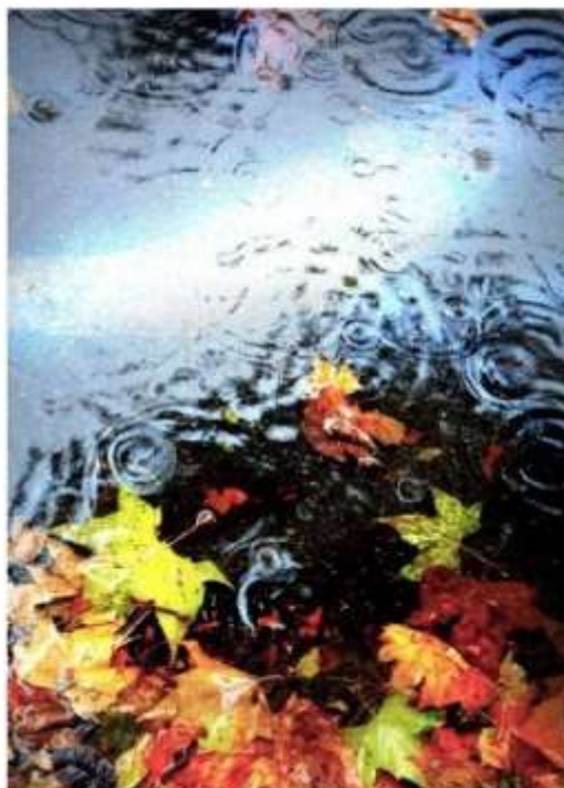
Concorso poesia e fotografia – Docente Maira Fucci Giornalino Scuola Chiaro Scuro n. 7