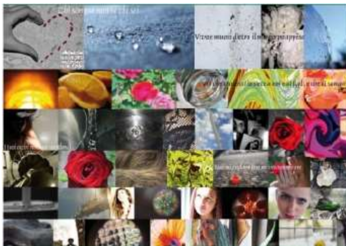
Giornalino Scuola Chiaro Scuro n. 8